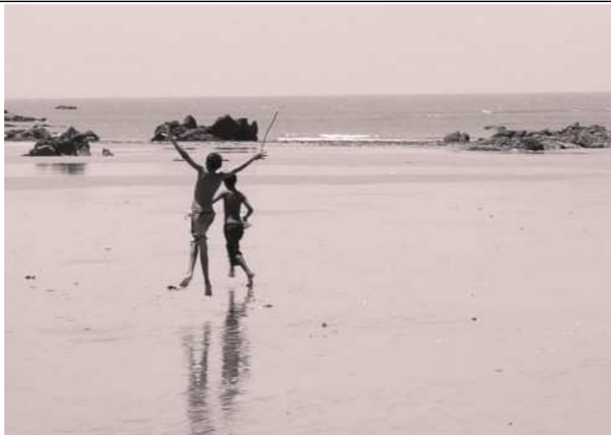
Meninos brincam na praia de Icapuí. Melquíades Junior. 2012.

Você já reparou nesse mundo sonoro a sua volta?